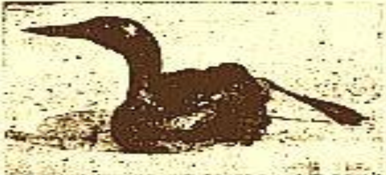
DEAD BIRDS... Thousands of dead animals, including birds, are scattered along the beach...

By Edward J. Pryor PALOMARES, Calif. (AP) — The wreckage of the B-52 bomber that crashed on the California coast Sunday is being treated as a major environmental disaster. The wreckage and the 66 million gallons of fuel oil that leaked from the plane are expected to smudge the beach for miles.