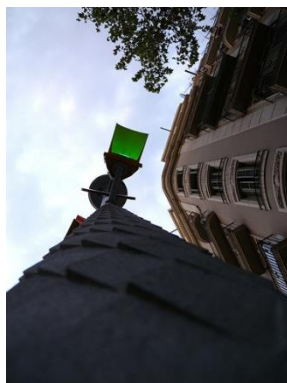
Figura 5. Semáforo en verde. Extraído de «Verde» de R. Ricote, Flickr . Licencia CC By 2.0.

Para incluir la cita bibliográfica dentro del texto hay que seguir las mismas normas que en los demás documentos: apellido y año de creación. Deberá indicarse asimismo entre paréntesis «véase figura» y el número de la misma.