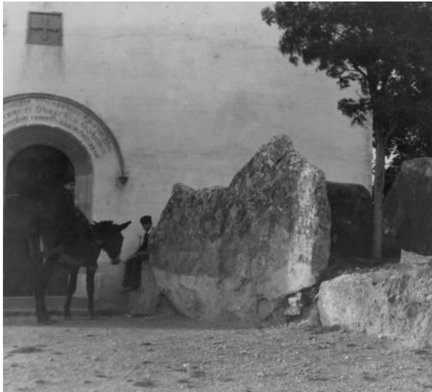
Figura 4. En esta fotografía puede apreciarse como a principios del siglo xx había un árbol en el espacio que queda entre las lápidas gigantes. Extraído de «Dos homes amb un ase davant el dolmen Puigseslloses a Folgueroles». Recuperado de http://mdc.cbuc.cat/utills/ajaxhelper/?CISOROOT=afcecemc&CISOPTR=3009&action=2&DMSCALE=40&DMWIDTH=409&DMHEIGHT=284&DMX=0&DMY=0&DMTEXT=&DMROTATE=0 . Memòria Digital de Catalunya . © Arxiu Fotogràfic Centre Excursionista de Catalunya.

Cita bibliográfica en el texto del trabajo: «...en una fotografía anónima de principios de siglo se aprecia como el árbol había crecido entre las piedras del dolmen (véase figura 4).»