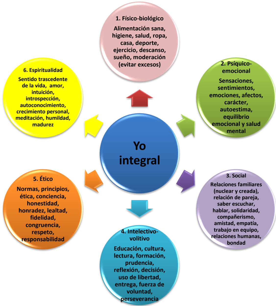
GRÁFICA 1. Dimensiones del Yo integral

resultados para introducir los cambios necesarios. (Sánchez F., F., 2003, p. 5.6)