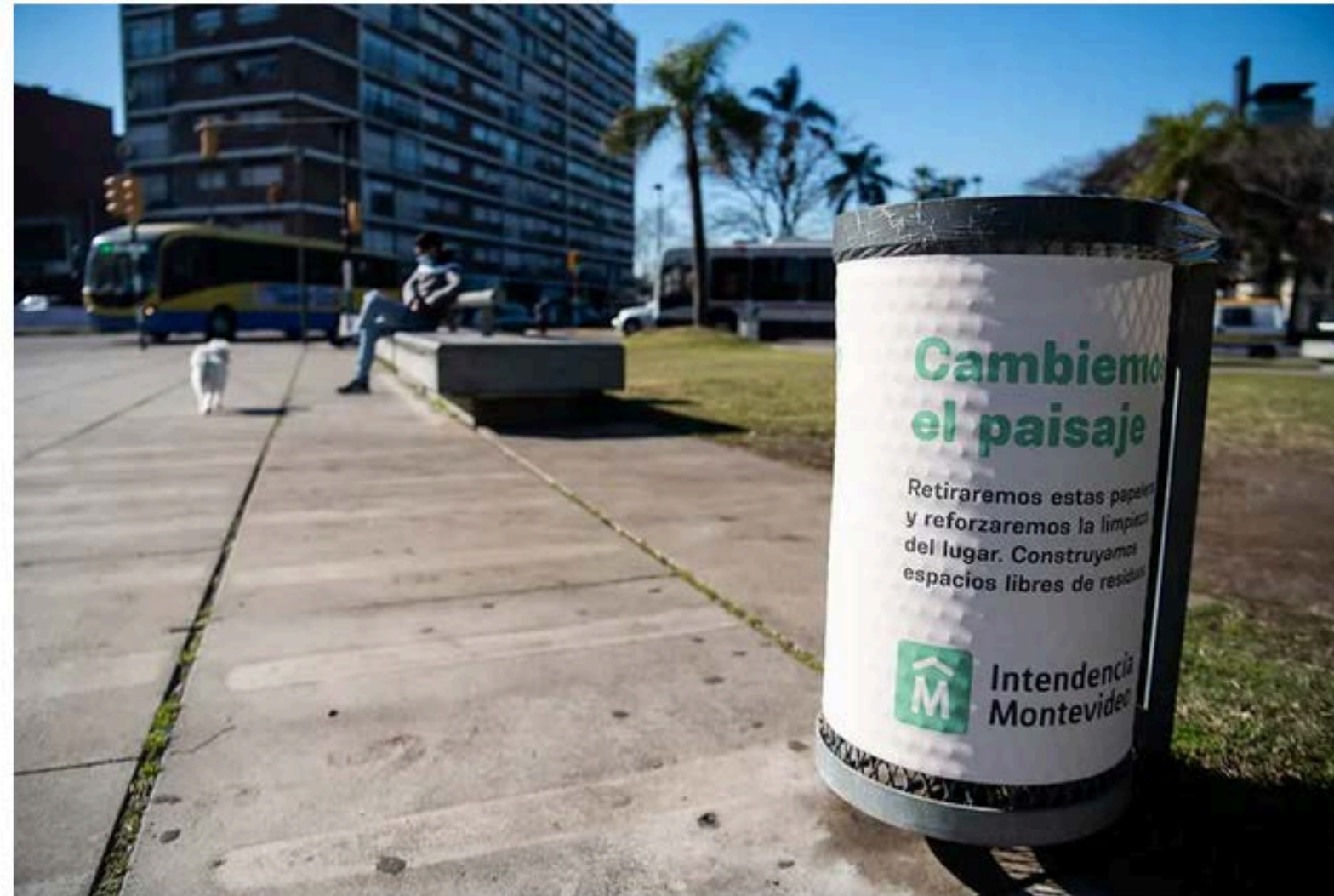
Papelera.