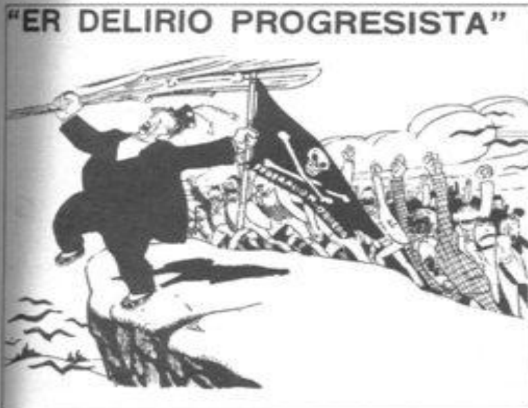
Imagen 11. Caricatura publicada en "El Siglo", el 23-6-1911. La bandera dice "Federación Obrera".

ción se volvía insostenible para el Gobierno que, a regañadientes y de muy mala gana, se resignó a anular el reglamento que lesionaba a las Compañías." 21