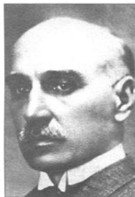
Imagen 2. Ing. José Serrato, Presidente de la República entre 1923 y 1927.

No fue éste, sin embargo, un camino sin resistencias y sobresaltos. El Partido Colorado, “partido del Estado” –en el gobierno desde 1865– conservaba los reflejos de una larga historia de manipulación de la voluntad popular, que la nueva institucionalidad no hizo desaparecer automáticamente. Durante la presidencia de Baltasar Brum, por ejemplo, se darían algunos incidentes paradigmáticos de esta persistencia de procedimientos ilegítimos. Brum, en un intento de unificar en torno a su persona el fraccionado partido de gobierno –al menos, ese fue su discurso, aunque habría otras interpretaciones posibles de su accionar, visto por algunos de sus contemporáneos como un intento de proyectarse como sucesor de Batlle y Ordóñez–, fundó el efímero “Partido Unión Colorada”, que participó por única vez en las elecciones del 30 de noviembre de 1919. La oposición nacionalista y también sus contrincantes dentro del Partido Colorado, lo acusaron de poner la maquinaria del Estado al servicio de esa apuesta electoral que tuvo, sin embargo, escasa convocatoria (obtuvo 9.151 votos).