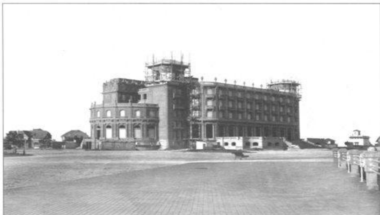
Imagen 10. Construcción del Hotel Casino Carrasco hacia 1917.

del trabajo nocturno, la implantación de la “semana inglesa” o la aprobación de pensiones a la vejez, recién serían aprobados luego de este período.