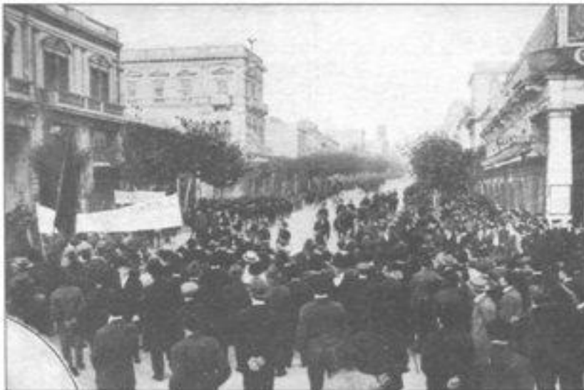
Imagen 5. 1º de Mayo de 1919. “Aspecto que ofrecía la Avda. 18 de Julio durante la manifestación obrera”.

En los pequeños establecimientos, en los talleres industriales y en la creciente concentración de trabajadores ferrocarrileros y portuarios se empezó a desarrollar un movimiento obrero que ya en 1890 tenía importantes organizaciones sindicales –en esta etapa, fundamentalmente a través de sociedades de resistencia “por oficio”–, y órganos de prensa, participando de movilizaciones internacionalistas como las del Primero de Mayo. Principalmente existieron dos grandes vertientes ideológicas en el movimiento obrero: la anarquista, que llegó a constituir una Federación (Federación Obrera Regional Uruguay) y ejercer una mayor influencia en las dos primeras décadas del siglo XX, y la socialista, de definición marxista. Asimismo, surgió una corriente social cristiana, que proponía un espacio sindical diferenciado de las corrientes revolucionarias. 9 Resulta interesante señalar que no pocos destacados intelectuales uruguayos simpatizaron rápidamente con estas corrientes ideológicas y pronto fueron construyendo una serie de expresiones “contestatarias” y “alternativas al sistema”, muy ricas y originales en algunos casos y de extraordinario peso hasta hoy día en la cultura nacional. Se encuentra aquí el origen de las “izquierdas”, que desde entonces han sido un componente fundamental de la experiencia social uruguaya.