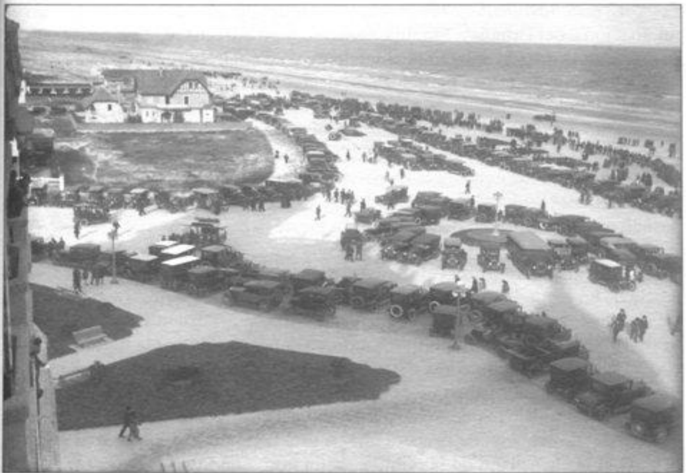
Imagen 6. Rambla de Carrasco a comienzos de los años veinte, con abundantes automóviles. Los primeros autos importados fueron de origen mayoritariamente europeo, pero rápidamente la industria automotora estadounidense se impuso y ya en 1919 el 60% del parque automotor era de este origen. Entre 1919 y 1930 se importaron más de 67.000 automóviles, y en 1930, el 82,5 % del monto de los automotores y sus repuestos importados por el Uruguay eran de origen norteamericano. A este gran desarrollo contribuyó la expansión de la red vial, promovida con empréstitos norteamericanos.

neamente, creció la demanda de bienes que no podía ser abastecida por la producción nacional (entre ellos los derivados del petróleo, al compás del acelerado desarrollo del parque automotor), incrementando así sustancialmente el volumen y el monto de nuestras importaciones. A pesar de que el saldo de la balanza comercial, compensado por un aumento en los volúmenes exportados, fue favorable en casi todo el período –con excepción de los años 1921 y 1922– no sucedió lo mismo con la balanza de pagos (saldo del intercambio de bienes y servicios con el exterior). Durante la mayor parte de la década el monto de las divisas necesarias para cubrir los servicios de la deuda externa (intereses y amortizaciones) y las remesas al extranjero por diversos conceptos (remesas de inmigrantes, ganancias de empresas extranjeras, etc.), fue mayor que el monto de las divisas que ingresaron al país por concepto de exportaciones y servicios varios (turismo, etc.).