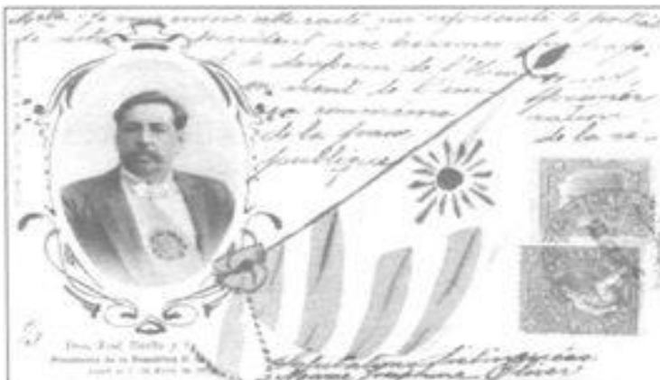
Imagen 7. Postal con José Batlle y Ordóñez con la Banda Presidencial, editada por Imprenta Galli.

Hijo de Lorenzo Batlle y Amalia Ordóñez y nieto de catalanes afincados en Montevideo en el último período de la dominación española. Su padre fue Presidente de la República entre 1868 y 1872. El 1 de marzo de 1903, cuando asumió su primera presidencia, tenía casi 47 años de edad y poseía una importante experiencia política y periodística iniciada en la lucha contra la dictadura del Gral. Máximo Santos en los años ochenta del siglo XIX. Fundador del diario "El Día", primer órgano de prensa de carácter masivo, predicaba a favor de la transformación de los partidos políticos. Afiliado al racionalismo espiritualista, proponía el desarrollo integral del hombre y de una sociedad igualitaria. Ocupó la Presidencia de la República en dos administraciones (1903-1907 y 1911-1915), integró el primer Consejo Nacional de Administración por cortos períodos en la década de 1920 e intervino en forma decisiva en la conducción del Partido Colorado hasta su muerte en 1929.