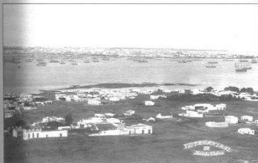
Imagen 1. Vista general de Montevideo hacia 1900. En ese entonces, la capital congregaba alrededor de la cuarta parte de la población del país.

bases de posteriores reformas. Entre ellos, los proyectos para la creación de un importante banco para el fomento de la producción nacional o las Leyes de Aduanas (1886 y 1888) de carácter proteccionista, es decir, que fijaban tasas diferenciales para la importación y exportación de acuerdo con el tipo de producto. Además del interés fiscal, presente en toda ley impositiva, se remarcaba la necesidad de promover la industria nacional. En el informe realizado por la Comisión de Hacienda de la Cámara de Representantes en 1887 se afirmaba: “la constitución de una nacionalidad y de una independencia económica está en el poder industrial propio, es decir, en los medios que tenga un país de desarrollar de un modo armónico sus fuerzas productivas, y de ensanchar y multiplicar los empleos del trabajo nacional, así como las inversiones fijas del capital” . 3