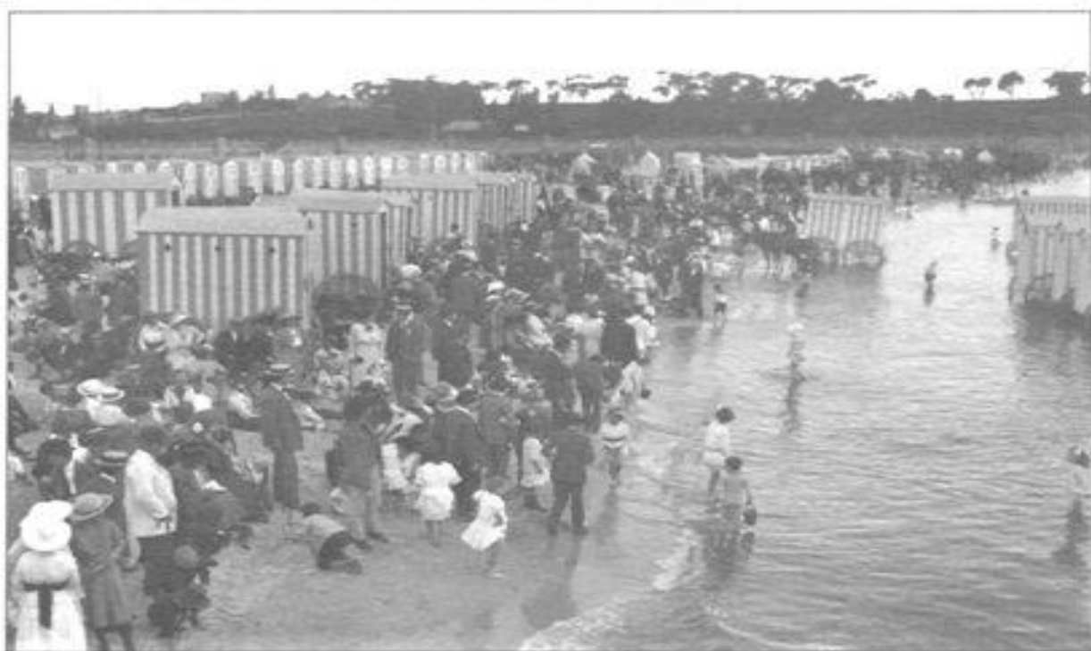
Imagen 4. Playa Ramírez a mediados de la década de 1910. El bañero, montado en una mula o un caballo se encargaba de tirar de los “carritos” y llevarlos al agua.