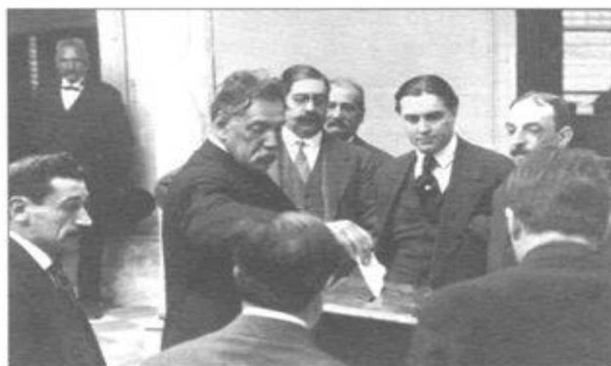
Imagen 1. José Batlle y Ordóñez votando. (FHM/CMDF).

Fue en estos años, en efecto, que se procesó la “ doma del poder ”, de la que habló Carlos Real de Azúa. Para este autor, dicho proceso implicó un triple esfuerzo: por regular, vigilar y aun debilitar al Poder Ejecutivo; por descongestionar y descentralizar la gestión estatal, y por efectivizar el ideal de gobierno democrático. 3