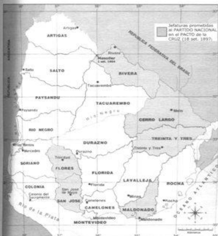
Imagen 6. Distribución de las jefaturas departamentales en 1897 y ubicación de la Batalla de Masoller en 1904.

El 10 de febrero de 1898 el presidente en ejercicio, Juan Lindolfo Cuestas, disolvió el parlamento y procedió a designar un Consejo de Estado que cumpliera funciones legislativas. Entre los argumentos dados para justificar tal acción, que contó con apoyo en algunos sectores del Partido Colorado, el Partido Nacional y el Partido Constitucional, figuró la necesidad de contar con las mayorías necesarias para cumplir con los acuerdos de setiembre de 1897. En efecto, durante 1898 se aprobaron la Ley de Registro Cívico Permanente (que procuró terminar con las inscripciones fraudulentas y estableció por primera vez el derecho de la minoría a participar en las mesas receptoras de votos) y la Ley de Elecciones, que implantó el principio de representación de las minorías, si bien aún no con carácter proporcional al número de sufragios: en cada departamento, la minoría debía acceder a la cuarta parte de los sufragios para obtener el tercio de las bancas correspondientes. 11