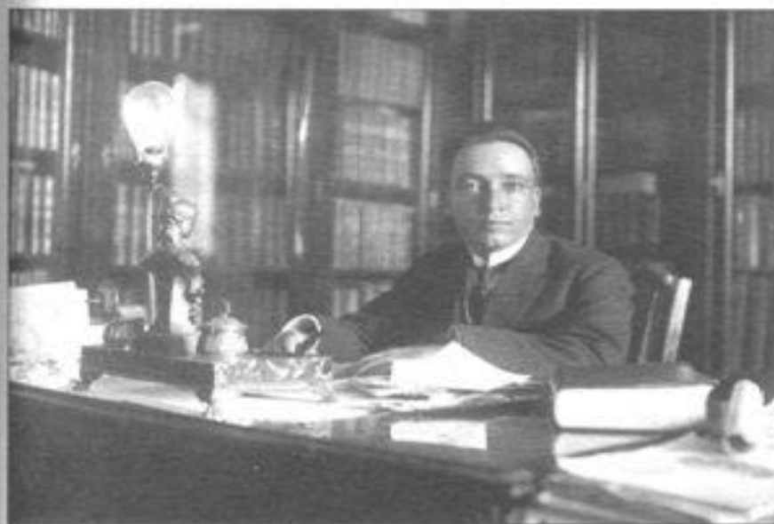
Imagen 3. Baltasar Brum en su despacho. Durante su presidencia (1919-1923) se inauguró el nuevo régimen constitucional que instauró un Poder Ejecutivo dual: el Presidente de la República y el Consejo Nacional de Administración.