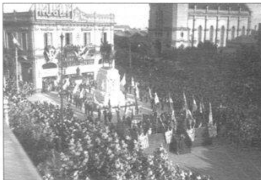
Imagen 8. Inauguración del Monumento al Gaucho en la intersección de la Avenida 18 de Julio y Constituyente. 31 de diciembre de 1927.