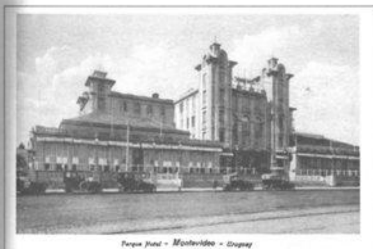
Imagen 9. Parque Hotel, frente a la Playa Ramírez. Montevideo.

en tal sentido “ serán siempre un buen negocio, aunque parezcan de lujo ”. 19 A fines del siglo XIX había comenzado el trazado del futuro balneario de Piriápolis, cuyos lotes se iban a vender también en Buenos Aires. En Montevideo se abrían nuevos parques (Parque Urbano, actual Parque Rodó en 1901 y Parque Central, actual Parque J. Batlle y Ordóñez, en 1907) y se ampliaban los ya existentes, como el Prado. También se extendía la zona de baños (balneario Capurro en 1900, por ejemplo), se proyectaba la construcción de una rambla desde el puerto hasta la playa y era inaugurado el Parque Hotel en 1909. Además de estos cambios, Jacob apunta a la formalización o fundación de nuevos balnearios en la franja costera: Punta del Este fue declarado oficialmente como pueblo en 1907; dos años más tarde se autorizó la construcción de un complejo turístico en el Real de San Carlos y hacia 1911 se proyectaba el balneario Atlántida. 20