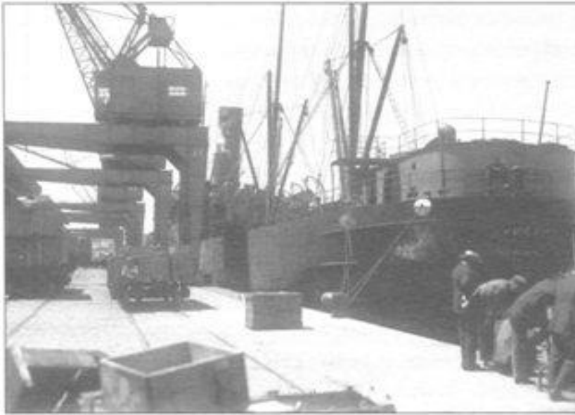
Imagen 2. Puerto de Montevideo. En 1911 llegaron al país las primeras veinte grúas.

can en este plano el inicio de las obras para modernizar el puerto de Montevideo (1900), la extensión de las líneas de ferrocarril, la extensión de los telégrafos y las primeras empresas de teléfonos.