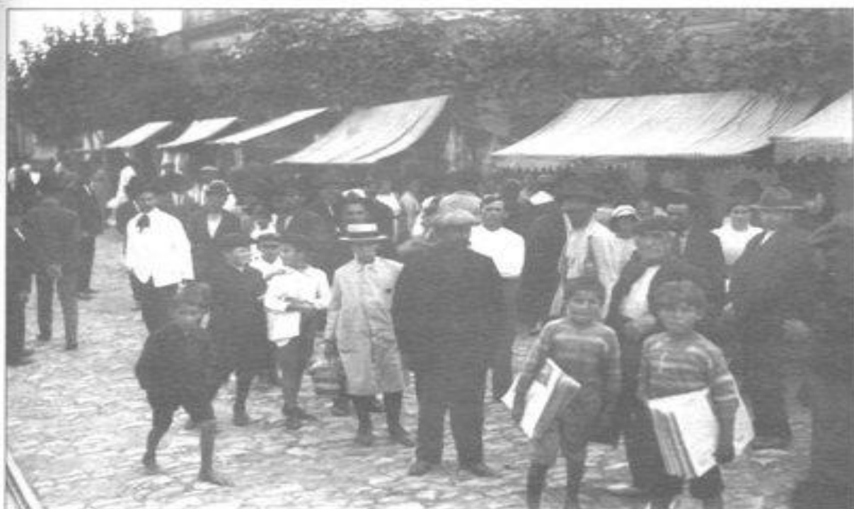
Imagen 3. La Feria de Tristán Narvaja hacia 1909. En primer plano, los “canillitas” vendiendo periódicos.