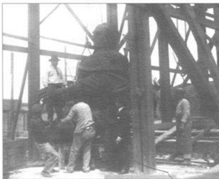
Imagen 7. Construyendo la imagen del héroe. Armado de las piezas del monumento a Artigas en la Plaza Independencia, en febrero de 1923.

memorar el Centenario, en las que el embellecimiento de la ciudad capital ocupó un lugar central.