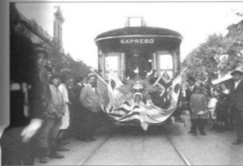
Imagen 8. Inauguración del servicio de tranvías eléctricos de “La Comercial”. Las líneas unían la Aduana con la Playa Pocitos.

la obtención de empréstitos para el desarrollo de las obras públicas. La operativa del puerto de Montevideo también fue objeto de iniciativas de monopolio estatal. Se argumentaba que luego de haber invertido importantes sumas en la modernización del puerto, correspondía al Estado obtener beneficios por su explotación. Ello dio lugar a encendidos debates, presión de las legaciones extranjeras y la formación del Centro de Navegación Transatlántica (1916). La Administración Nacional del Puerto de Montevideo (1916), al igual que el Banco de Seguros del Estado, comenzó sus actividades sin el monopolio de los servicios, si bien la ley autorizaba al Poder Ejecutivo a decretarlo cuando lo estimara pertinente.