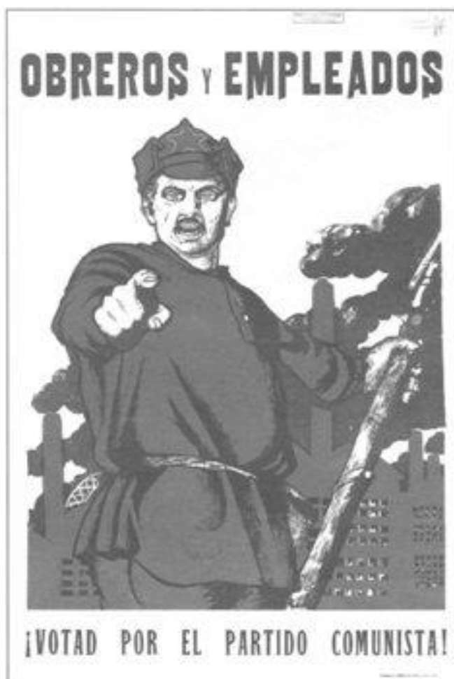
Imagen 5. Afiche del Partido Comunista uruguayo utilizado durante la campaña electoral de 1926. Esta imagen, que se difunde por primera vez, se encuentra anexa al informe enviado al Departamento de Estado por el Ministro de Estados Unidos en Montevideo, U. Grant Smith, el 30 de noviembre de 1925. En dicho informe el diplomático señalaba: "Estoy firmemente convencido que he visto un idéntico poster bolchevique en Europa Central, probablemente en Hungría..." .

Por último, un elemento a tener en cuenta al considerar la estrategia conservadora, es el factor militar. El batllismo se había distanciado del ejército, en la medida que su particular forma de nacionalismo —impregnado de cosmopolitismo— no ambientaba el culto del tradicionalismo y el patriotismo, tan caros a la institución militar. No contribuyó a mejorar dichas relaciones la posición contraria mantenida por José Batlle y Ordóñez y su partido en torno al proyecto de servicio militar obligatorio presentado en 1923 por el Presidente Serrato y su Ministro de Guerra, el Coronel Roberto Riverós. El batllismo se opuso tenazmente a la iniciativa que era, en los hechos, una propuesta de servicio militar bastante atenuada en duración e intensidad. El proyecto no contó con respaldo popular y terminó siendo retirado del parlamento por Serrato; Herrera, que al principio lo había acompañado, terminó por restarle su apoyo ante la firme resistencia popular, incluida la de sus correligionarios. Era un secreto a voces que la mayor parte de los oficiales tenían simpatías por los sectores conservadores del Partido Colorado y muy excepcionalmente, por el Partido Nacional. Las investigadoras Mónica Maronna e Yvette Trochon, así como Carlos Manini Ríos, en sus trabajos sobre el período, dan cuenta de numerosas circunstancias en las que el factor militar pesó en el acontecer político, lo que