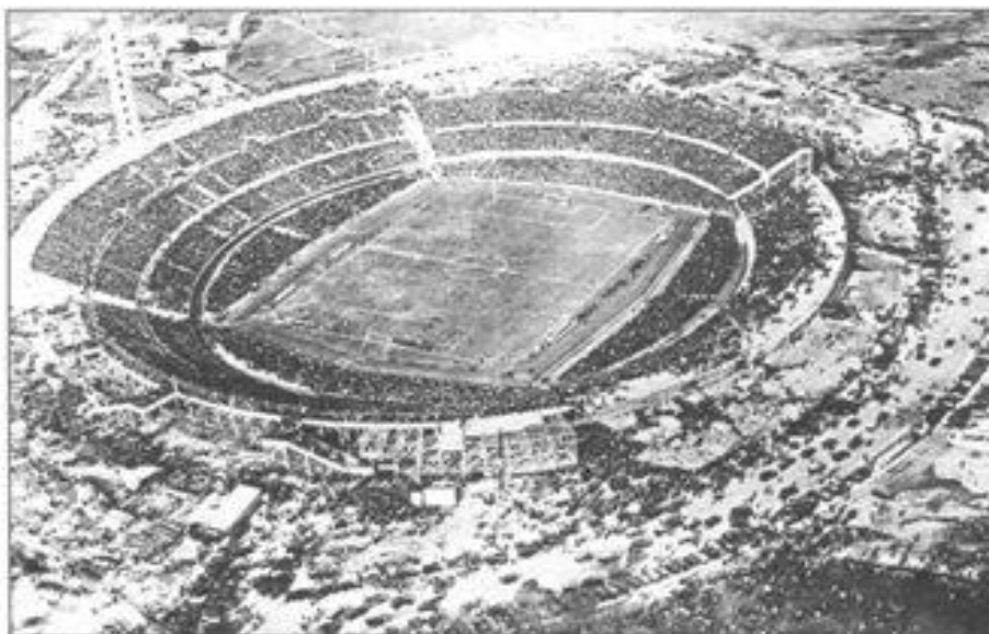
Imagen 9. Vista aérea del Estadio Centenario durante la final entre Uruguay y Argentina, el 30 de julio de 1930. (Archivo E.B.O.)

A comienzos de año los sectores conservadores habían recibido el espaldarazo del Presidente Campisteguy, quien en su mensaje anual a la Asamblea General, se sumó a los reclamos antirreformistas pidiendo un nuevo “alto” en materia de legislación social.