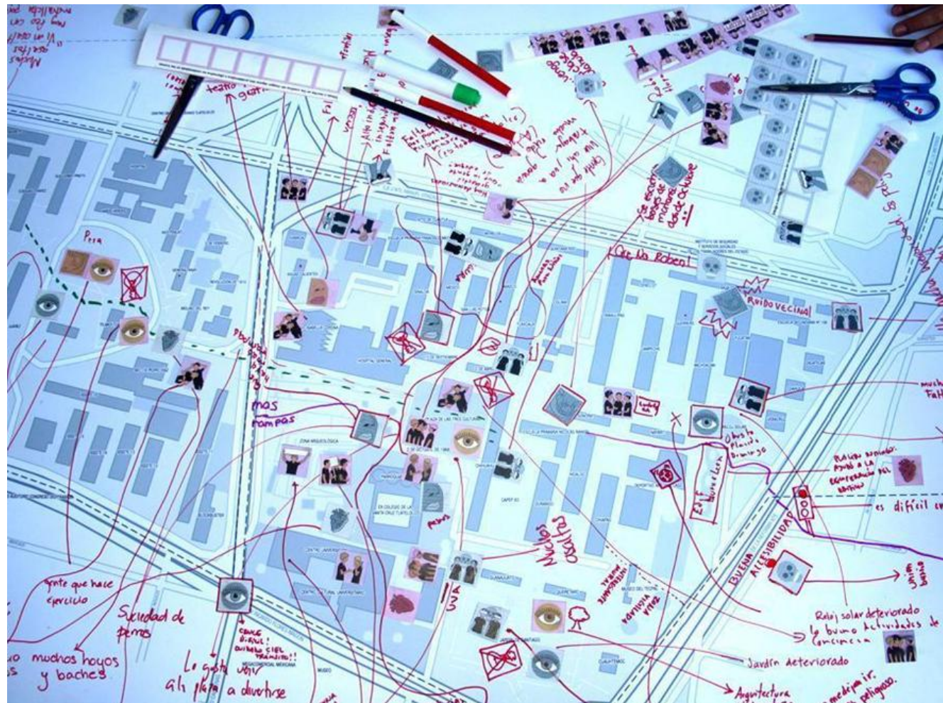
Figura 10.3. Ejemplo de mapeo participativo