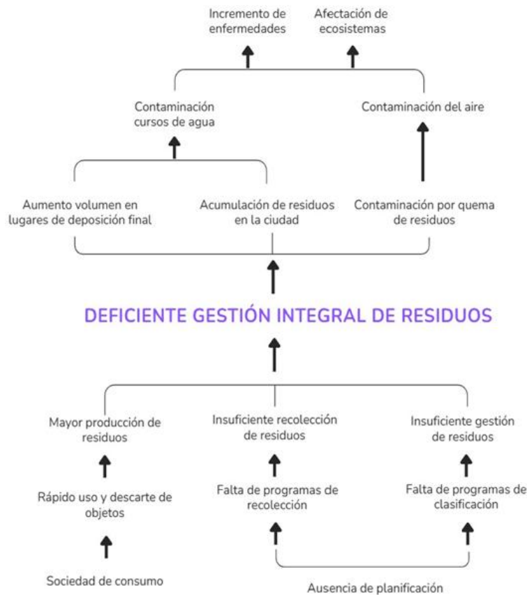
Figura 10.4. Árbol de problemas (izquierda) y árbol de soluciones (derecha)