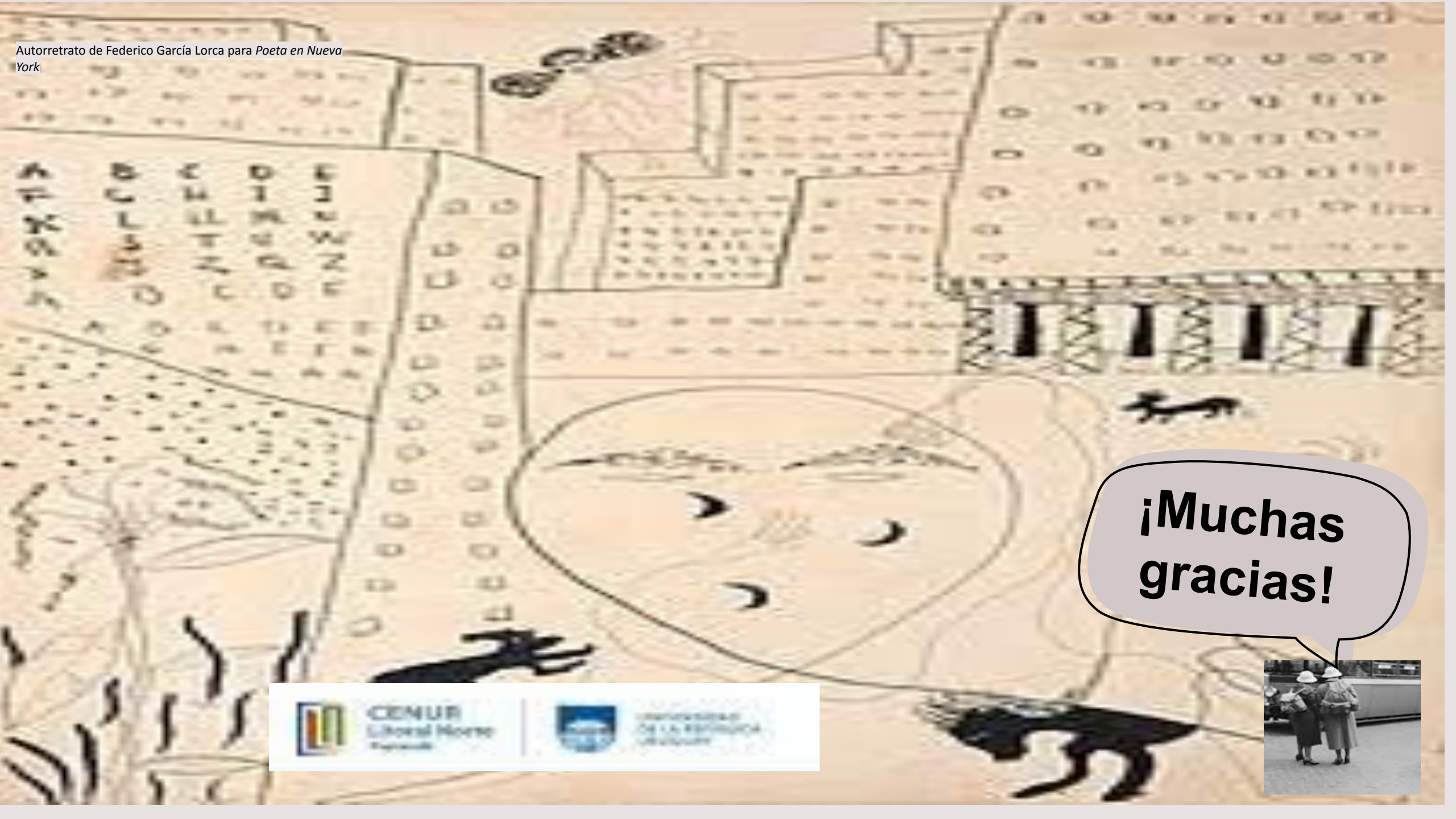
Autorretrato de Federico García Lorca para Poeta en Nueva York