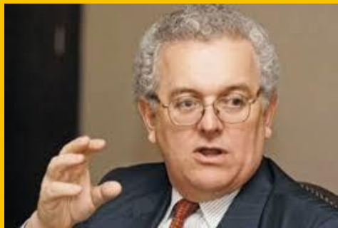
José Antonio Ocampo Comte