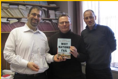
Acemoglu, Johnson, & Robinson