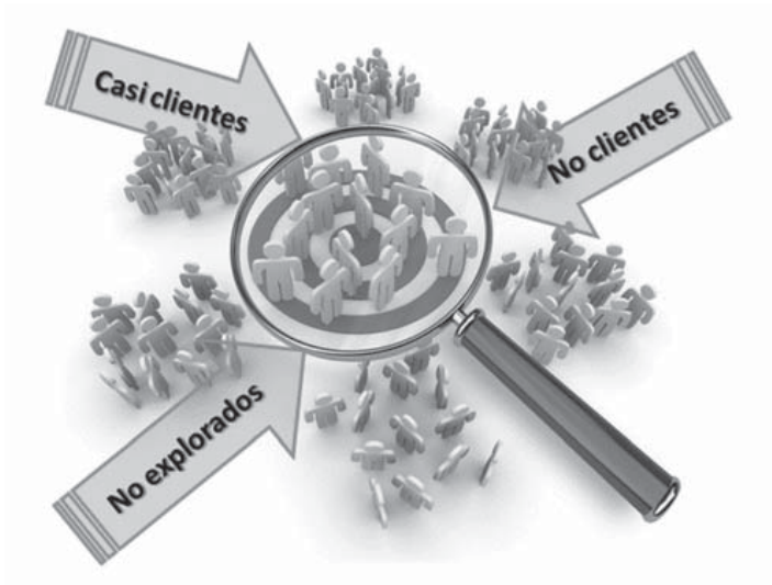
Gráfico 3 Grupos de no consumidores