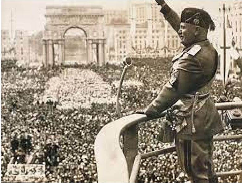
Régimen fascista de Benito Mussolini en Italia (1922-1945)