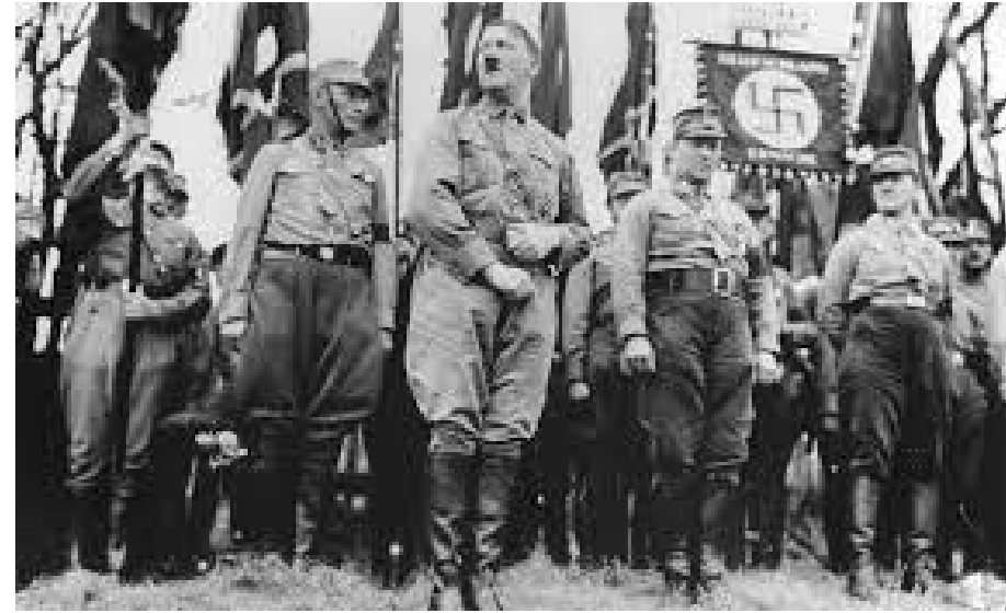
Régimen nazista de Adolf Hitler en Alemania (1933-1945)