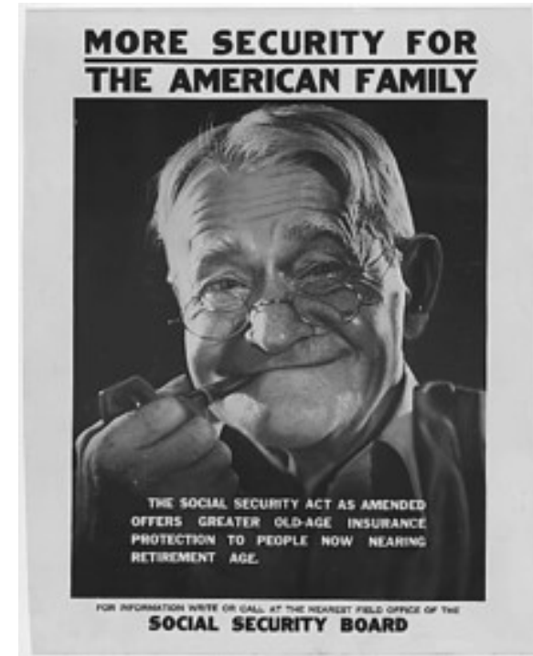
Cartel promocional para la Ley de Seguridad Social en Estados Unidos ,1935