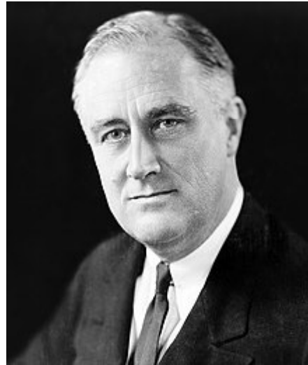
Franklin Roosevelt, presidente de Estados Unidos y promotor del New Deal en la década de 1930, post crisis de 1929