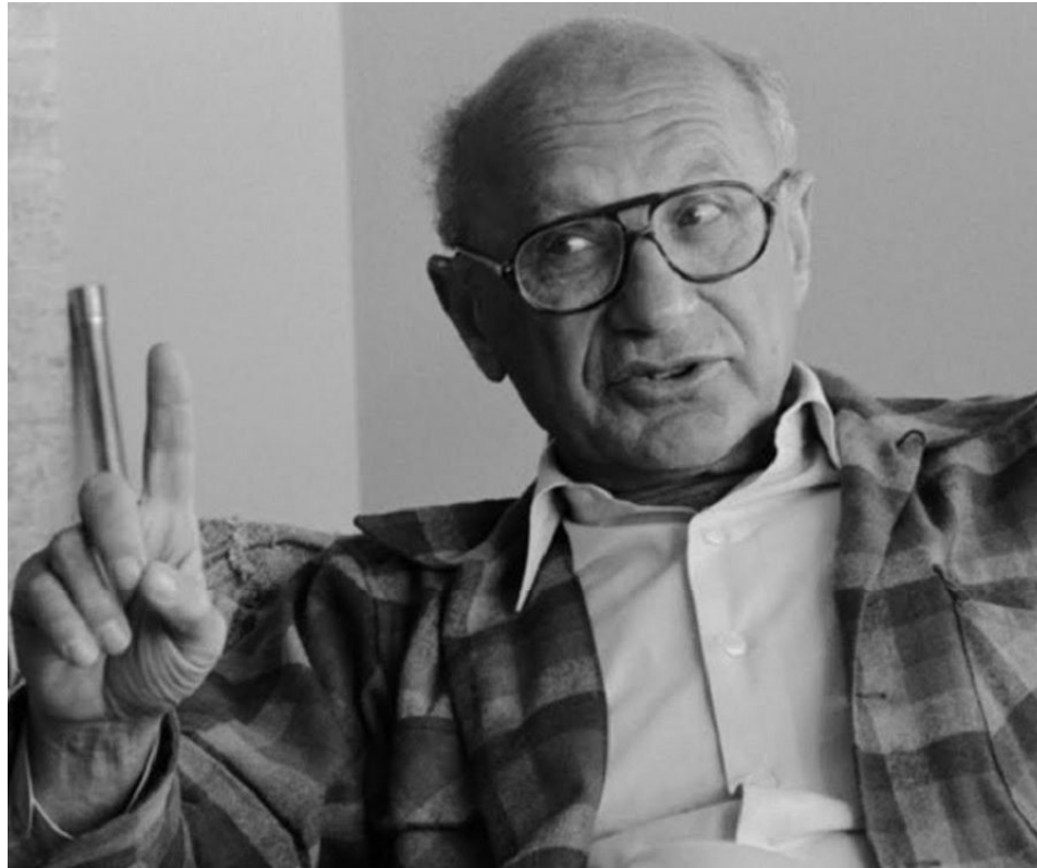
Milton Friedman (Estados Unidos, 1912-2006)