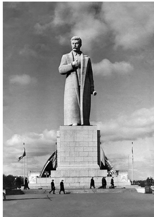
Régimen poscapitalista de la Unión de Repúblicas Socialistas Sovéticas (1922-1991)