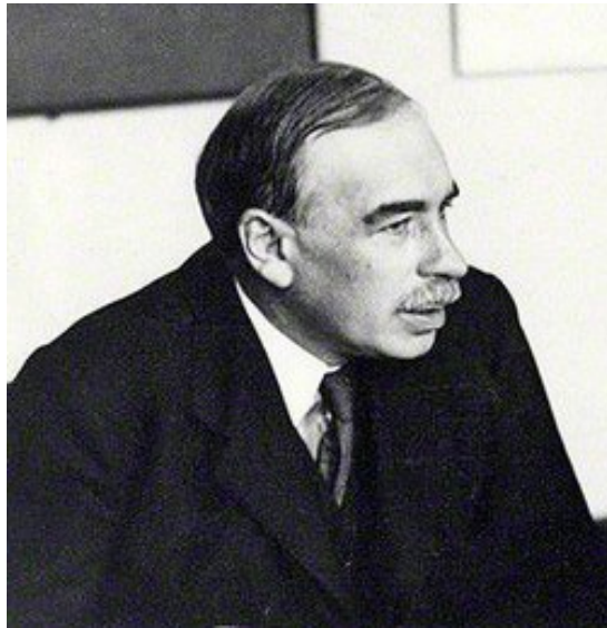
John Keynes, economista británico, en 1933