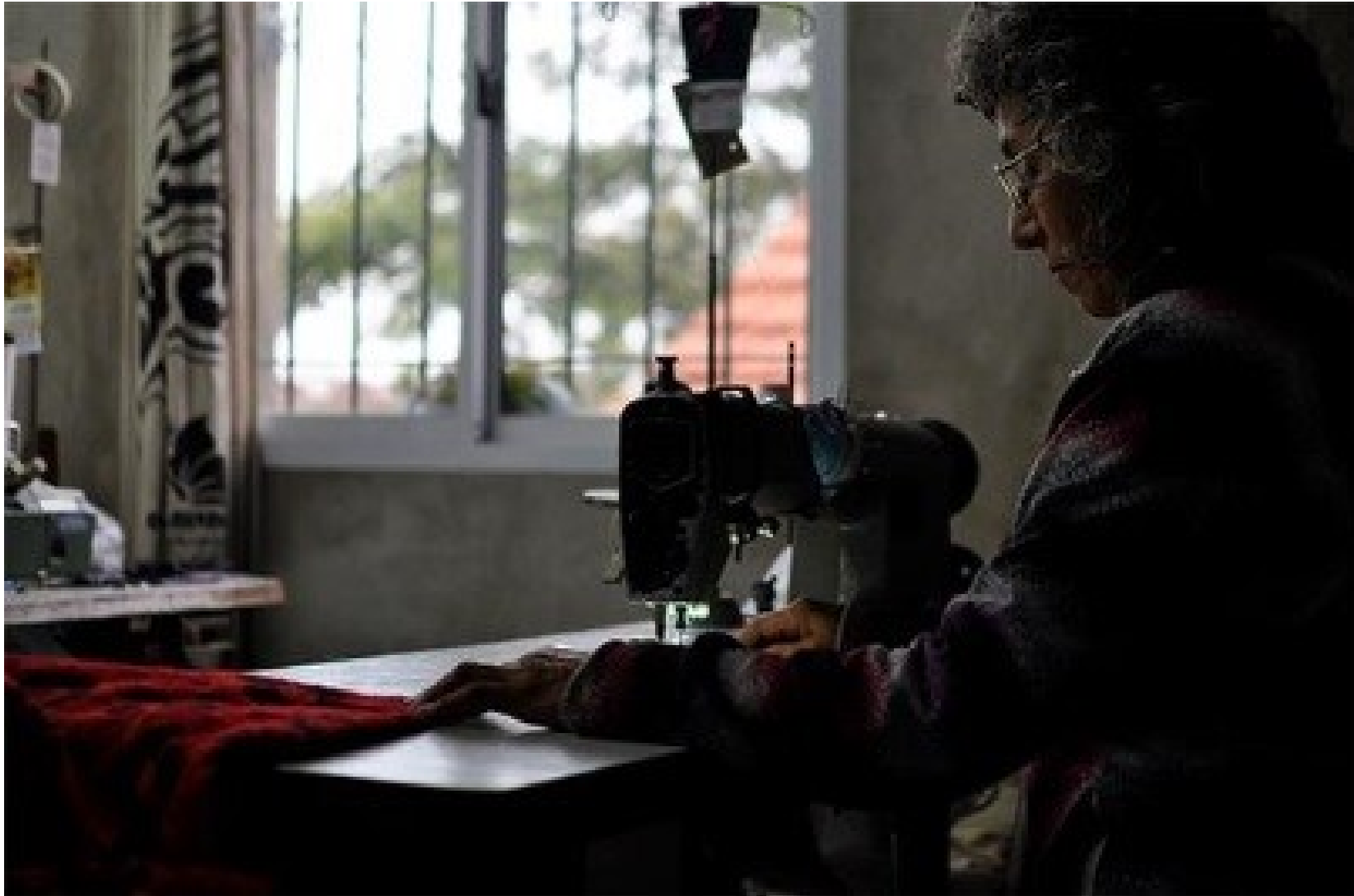
Costureras, subregistradas e invisibilizadas.