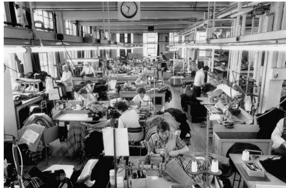
Figura "Burberry's. The factory where the famous coats are made. The factory floor", 1983. Autor: Peter Marlow. Fuente: Magnum Photos

Para entender mejor el tema del trabajo y la desigualdad de género, leemos SONIA YÁÑEZ: Producción, reproducción y orden de género