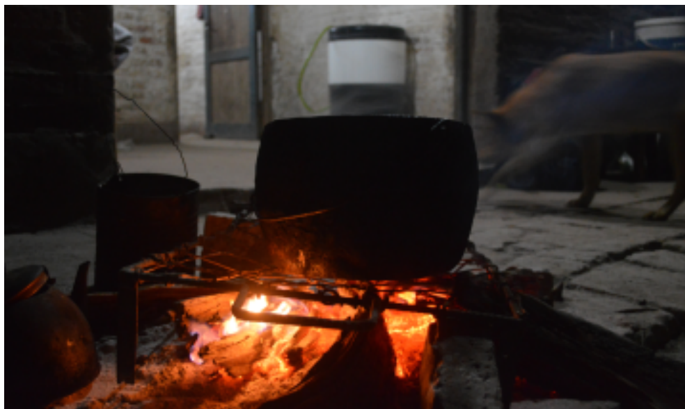
Figura 6. La reunión al atardecer en el patio doméstico ( laxoxoc ) es el espacio-tiempo de la comensalidad para los moqoit , en áreas rurales. San Lorenzo, Pcia. de Chaco, Argentina, 2013.

Ya sugerimos que en este período quienes estaban realizando actividades lejos de la unidad domestica retornan a la misma o se preparan para hacer noche en otro sitio. El atardecer es por tanto el momento característico en el que comienzan a reunirse los diversos miembros de la familia extensa que habitan en el conjunto de pequeñas casas