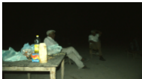
Figura 7. El atardecer en el patio doméstico ( lasoxoc ) es también el espacio para muchas de las observaciones moqoit del cielo, acompañadas de relatos sobre el tiempo de los antiguos. Santa Rosa, Pcia. de Chaco, Argentina, 2013.

El crepúsculo matutino es el otro momento clave de experiencia del cielo nocturno. Pese a tener eso en común, posee connotaciones diferentes al crepúsculo vespertino. Los moqoit denominan te etá a la madrugada, y richilecna (aclara), richiguiñi (amanece, es claro), o nenoxonshiguim ra'aasa (sale –para arriba- “la sol” 28 ) al amanecer. Como señaláramos, nete'é es la mañana y nete'ese de la mañana. Es muy frecuente que los miembros más ancianos de la familia se levanten bastante antes de que salga el sol y se considera que eso es lo deseable para