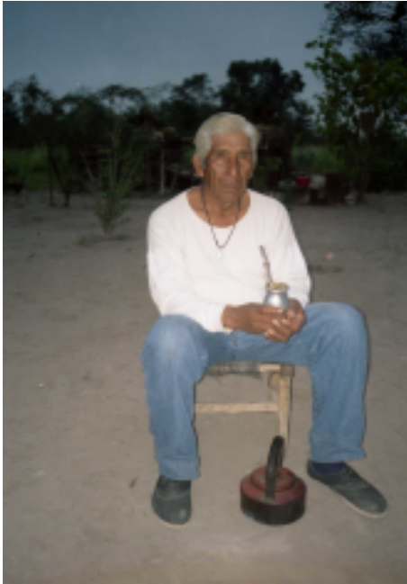
Figura 8. Los ancianos suelen levantarse antes del amanecer. El mate y el silencio caracterizan este período, en el que se dan muchas experiencias del cielo. Santa Rosa, Pcia. de Chaco, Argentina, 2007.

jornada, pidiéndole fuerza y animando a los niños a levantarse. Era muy habitual su uso para la primera mitad del siglo XX. Varios interlocutores nos relataron que solían ser las abuelas quienes levantaban de este modo a sus nietos. En algunas de dichas oraciones se usa una denominación para "la Sol", Larrimina , diferente de la usual ( ra'aasa ) y que es señalada como "antiguo" o "verdadero" moqoit . Hoy día las horas previas al amanecer suelen ser el tiempo de esperar al patrón criollo que pasa a recoger a quienes se dirigen a trabajar en sus campos, o de salir caminando para llegar al pueblo cercano