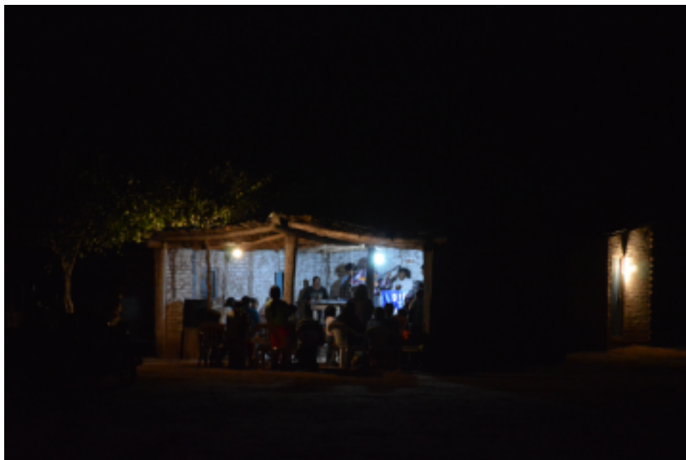
Figura 9. Los cultos en el evangelio, muchos de ellos nocturnos, son lugar de experiencias extáticas con importantes continuidades con la experiencia shamánica, que incluyen viajes al cielo. San Lorenzo, Pcia. de Chaco, Argentina, 2013.

En dicho contexto, en los cultos y durante la oración para curar dolencias, son frecuentes las experiencias en las cuales creyentes evangelio viajan al cielo. Como hemos mencionado en otros trabajos (López 2013; López y Altman 2017), estos cielos del evangelio son cielos que incluyen un paisaje que es una resignificación de motivos bíblicos -como la Jerusalén celeste- desde la experiencia chaqueña. Así junto a los muros de la ciudad santa, los parientes difuntos del viajero pueden estar cultivando buen algodón en su campo del cielo. Los ángeles son frecuentes compañeros de estos ascensos al cielo, pero la dinámica de lo que allí ocurre, centrada en los dones que el viajero trae luego de pactar con alguna de las entidades celestes,