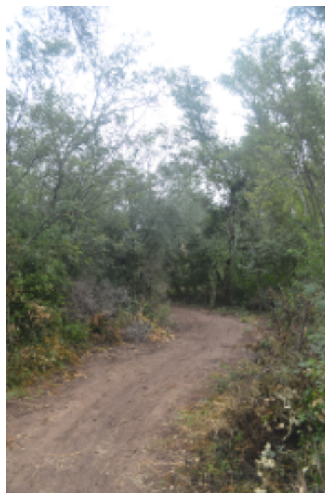
Figura 5. Camino ( nayic ) que se interna en el monte ( 'oochi ), Santa Rosa, Pcia. de Chaco, Argentina, 2013.

Bajo ciertas circunstancias, como ya detallaremos,