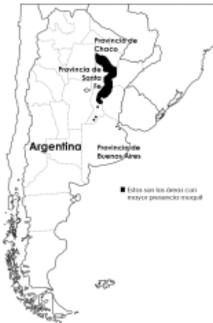
Figura 1. Mapa de la zona de mayor presencia de los moqoit .

Actualmente los moqoit viven en comunidades rurales, urbanas y periurbanas, principalmente en las provincias de Chaco y Santa Fe. Su población es de alrededor de 18.000 personas (INDEC 2015). Hemos realizado trabajo de campo etnográfico en las comunidades de Santa Rosa, San Lorenzo (parte de la Colonia General Necochea o Colonia Cacique Catán), Colonia Juan Larrea, El Pastoril, San Bernardo, Colonia Aborigen Chaco de la provincia del Chaco, y Recreo y Tostado de la Provincia de Santa Fe.