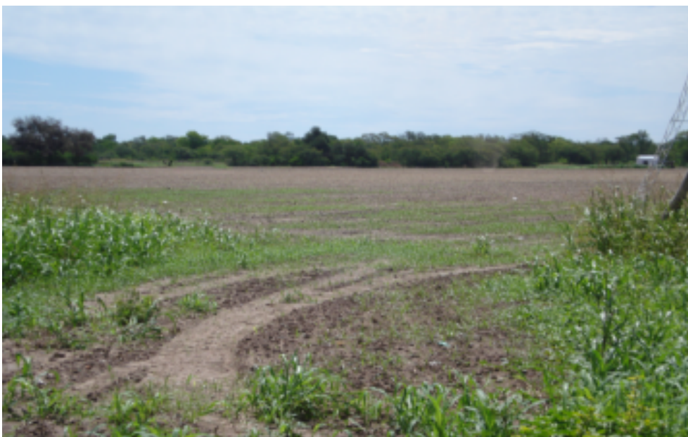
Figura 4. Paisaje de campo ( no'ueenaxa ), Santa Rosa, Pcia. de Chaco, Argentina, 2007.

el qagreta nevec (guazuncho, mazama gouazoupira ) como el cos (pecarí, tayassu pecari ) se ocultan en el monte, los mañic (ñandú, rhea americana ) prefieren el campo abierto. En la actualidad el campo abierto remite a un territorio dominado por la agricultura de los criollos y por contraste el monte cerrado, se ve como un territorio difícil de explorar y por tanto propicio para ocultarse. De hecho, se lo piensa como el territorio en el que los animales y los antiguos (so 'auaxaic leta'allipi ) 20 , es decir los aborígenes de la generación de los abuelos de nuestros interlocutores y más atrás, se ocultan del avance de los doqoshi . Es por ello que se transformó en