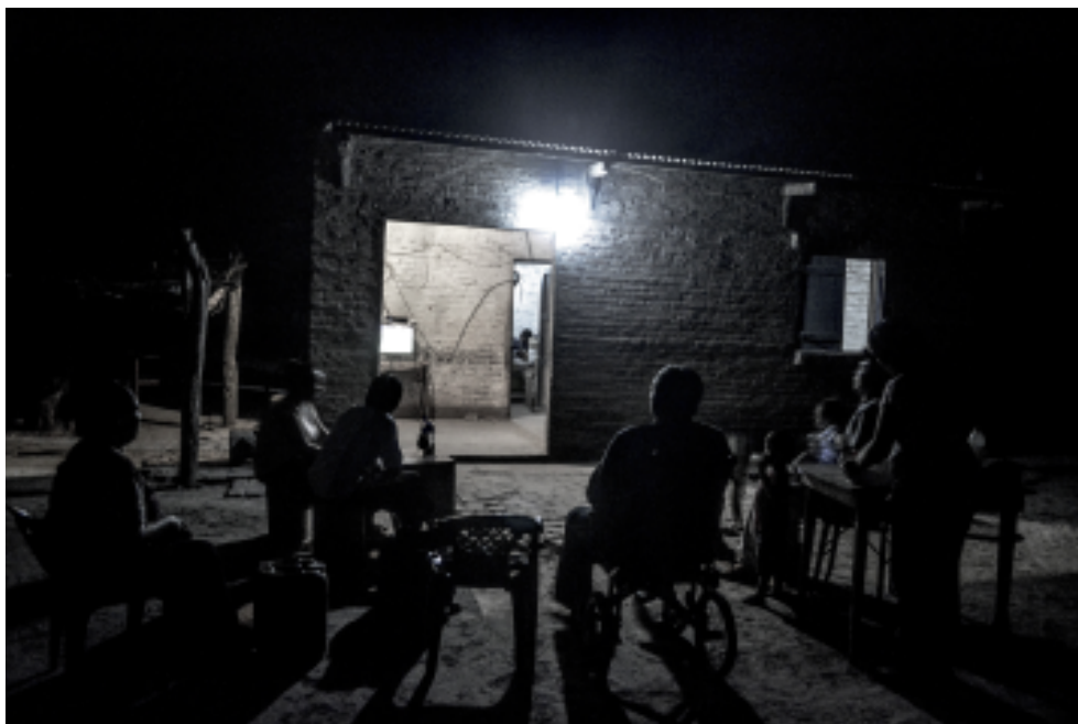
Figura 2. Presencia del televisor en el patio común de un conjunto de viviendas moqoit en una zona rural, San Lorenzo, Pcia. de Chaco, Argentina, 2013.